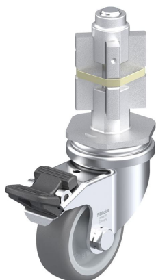
Blocage standard associé LRA-TPA 50G-FI-E05