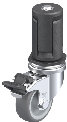
Blocage standard associé LRA-TPA 50G-FI-ER05