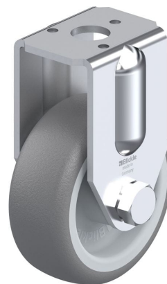
Roulette fixe correspondante BRA-TPA 50G