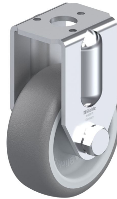
Roulette fixe correspondante BRA-TPA 50G