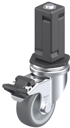
Blocage standard associé LRA-TPA 50G-FI-EV04