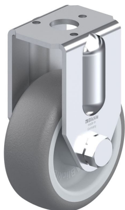
Roulette fixe correspondante BRA-TPA 50G