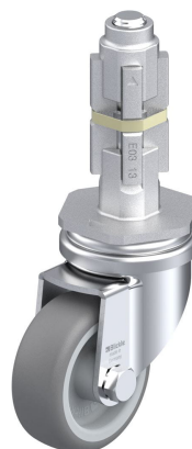
Roulette pivotante correspondante LRA-TPA 50G-E03