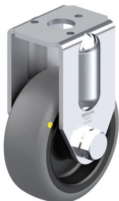
Roulette fixe correspondante BRA-TPA 50G-ELS