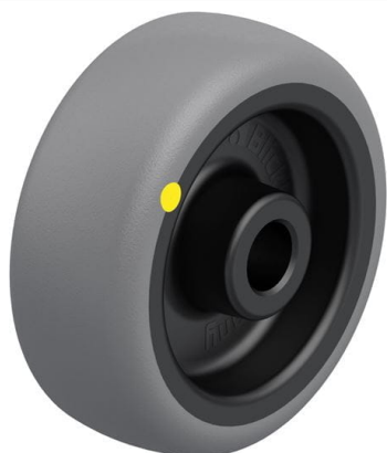
Roue utilisée TPA 50/8G-ELS