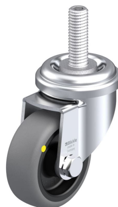
Roulette pivotante correspondante LRA-TPA 50G-ELS-GS10