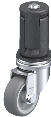
Roulette pivotante correspondante LRA-TPA 50G-ER05