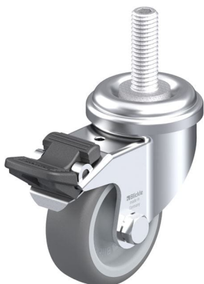
Blocage standard associé LRA-TPA 50G-FI-GS10