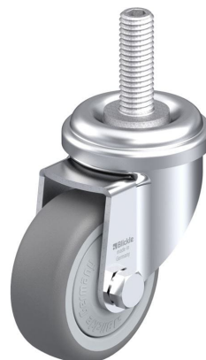
Roulette pivotante correspondante LRA-TPA 50KF-GS10