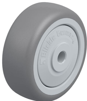
Roue utilisée TPA 50/6KF