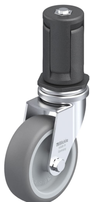
Blocage standard associé LRA-TPA 75G-ER05