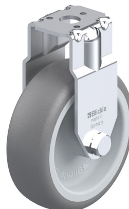
Roulette fixe correspondante BRA-TPA 75G