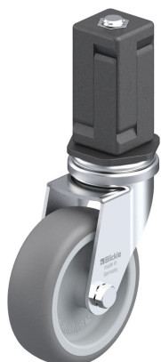
Blocage standard associé LRA-TPA 75G-EV05