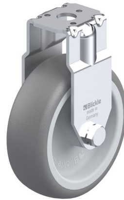
Roulette fixe correspondante BRA-TPA 75G