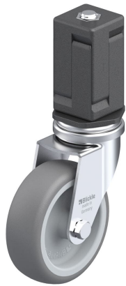
Blocage standard associé LRA-TPA 75G-EV07