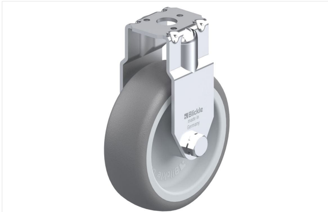
Roulette fixe correspondante BRA-TPA 75G