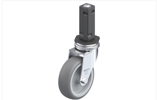
Roulette pivotante correspondante LRA-TPA 75G-EV03