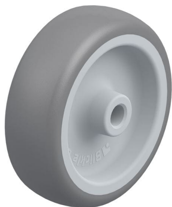
Roue utilisée TPA 75/8G