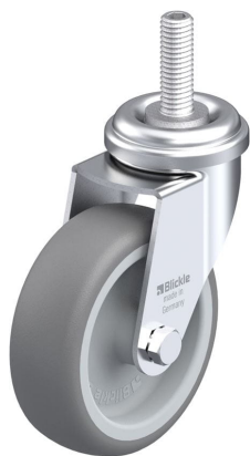
Blocage standard associé LRA-TPA 75G-GS10