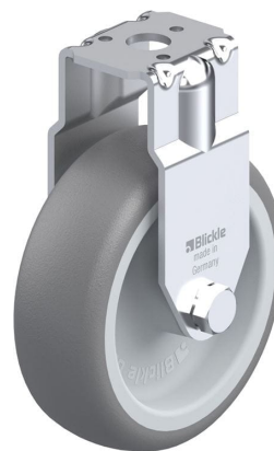
Roulette fixe correspondante BRA-TPA 75G