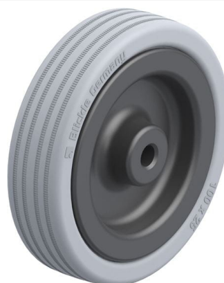
Roue utilisée VPA 100/8G