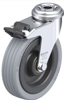
Blocage standard associé LRA-VPA 100K-FI