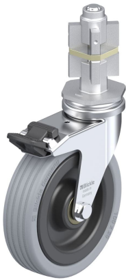
Blocage standard associé LRA-VPA 100K-FI-E05