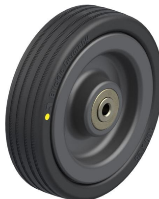
Roue utilisée VPA 100/6K-EL