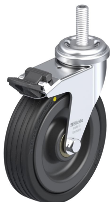
Blocage standard associé LRA-VPA 100K-FI-EL-GS10