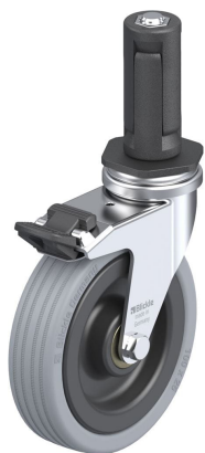
Blocage standard associé LRA-VPA 100K-FI-ER03