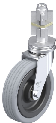
Roulette pivotante correspondante LRA-VPA 100K-E05