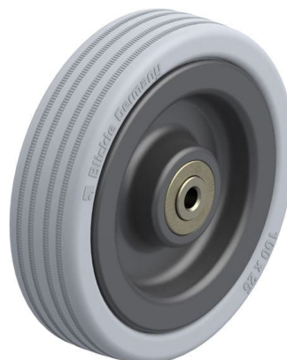
Roue utilisée VPA 100/6K