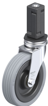
Roulette pivotante correspondante LRA-VPA 100K- EV04