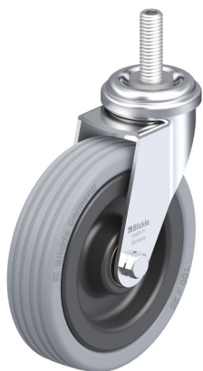
Roulette pivotante correspondante LRA-VPA 100K-GS10