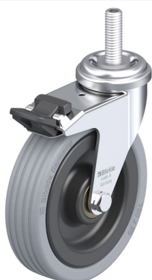
Blocage standard associé LRA-VPA 100K-FI-GS10