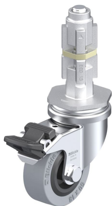
Blocage standard associé LRA-VPA 50G-FI-E03