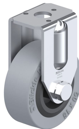
Roulette fixe correspondante BRA-VPA 50G