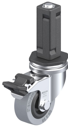
Blocage standard associé LRA-VPA 50G-FI-EV03