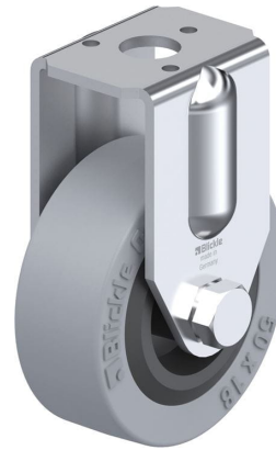
Roulette fixe correspondante BRA-VPA 50G