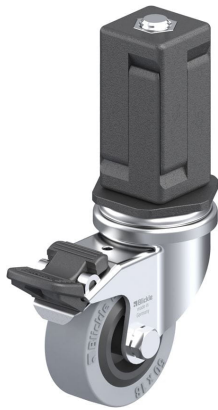
Blocage standard associé LRA-VPA 50G-FI-EV05