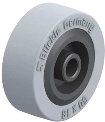
Roue utilisée VPA 50/8G