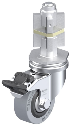
Blocage standard associé LRA-VPA 50G-FI-FA-E05