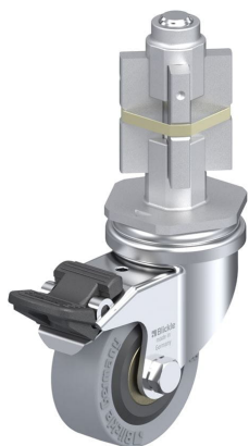
Blocage standard associé LRA-VPA 50K-FI-E05