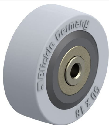
Roue utilisée VPA 50/6K