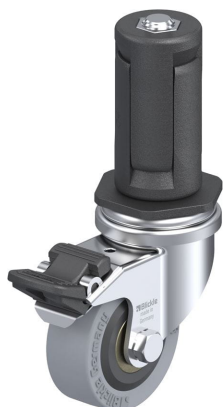
Blocage standard associé LRA-VPA 50K-FI-ER04