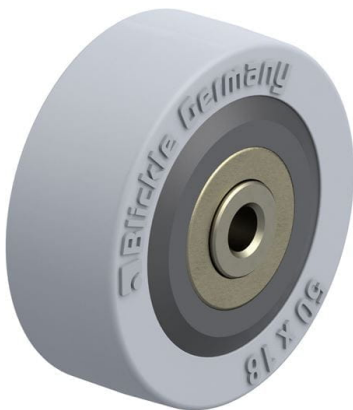
Roue utilisée VPA 50/6K