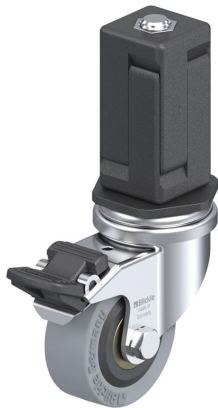
Blocage standard associé LRA-VPA 50K-FI-EV05