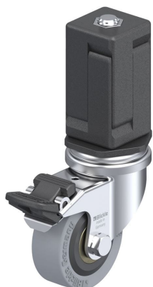
Blocage standard associé LRA-VPA 50K-FI-EV07