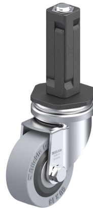
Roulette pivotante correspondante LRA-VPA 50K-EV02