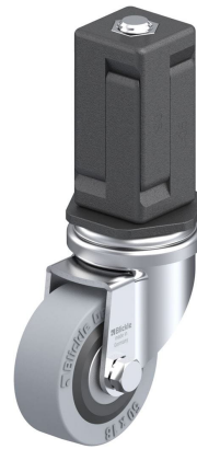
Roulette pivotante correspondante LRA-VPA 50K-EV05