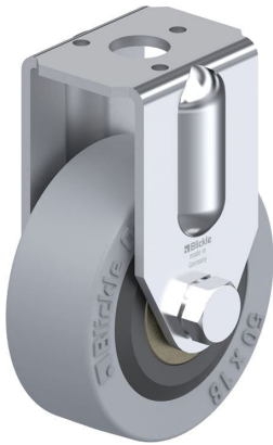
Roulette fixe correspondante BRA-VPA 50K