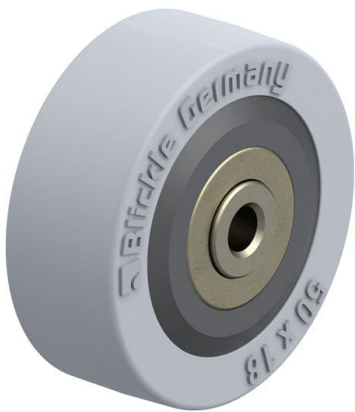
Roue utilisée VPA 50/6K