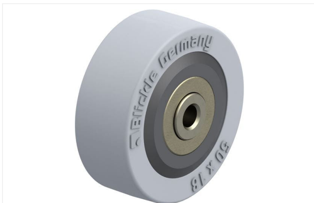
Roue utilisée VPA 50/6K