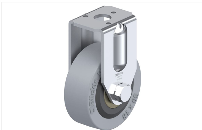
Roulette fixe correspondante BRA-VPA 50K