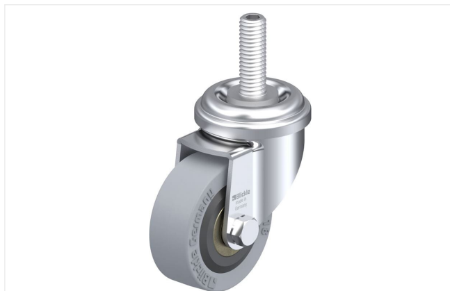
Roulette pivotante correspondante LRA-VPA 50K-GS10