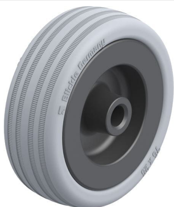
Roue utilisée VPA 75/8G