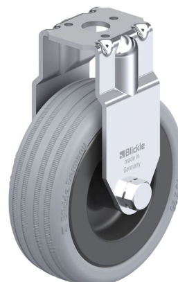
Roulette fixe correspondante BRA-VPA 75G