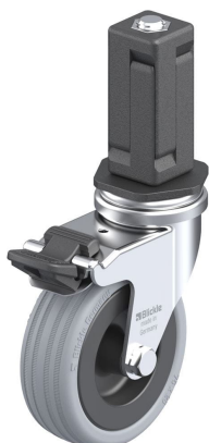
Blocage standard associé LRA-VPA 75G-FI-EV04