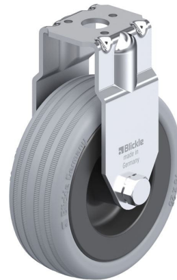
Roulette fixe correspondante BRA-VPA 75G