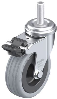
Blocage standard associé LRA-VPA 75G-FI-GS10