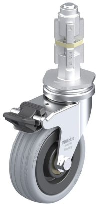
Blocage standard associé LRA-VPA 75K-FI-E03