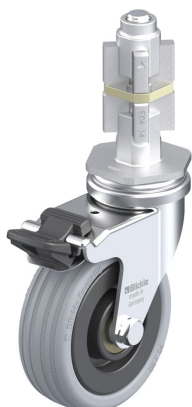
Blocage standard associé LRA-VPA 75K-FI-E04