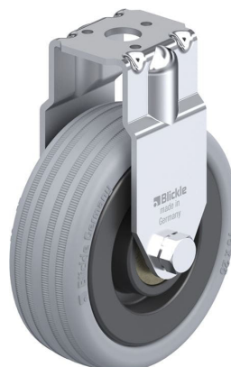
Roulette fixe correspondante BRA-VPA 75K