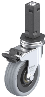
Blocage standard associé LRA-VPA 75K-FI-EV03