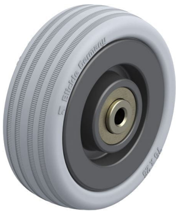
Roue utilisée VPA 75/6K