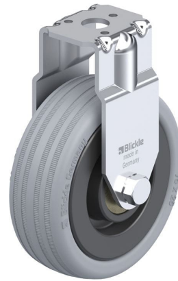
Roulette fixe correspondante BRA-VPA 75K