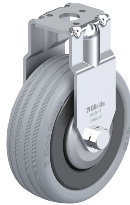
Roulette fixe correspondante BRA-VPA 75K-FA