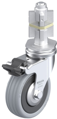
Blocage standard associé LRA-VPA 75K-FI-FA-E05