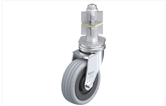
Roulette pivotante correspondante LRA-VPA 75K-E05