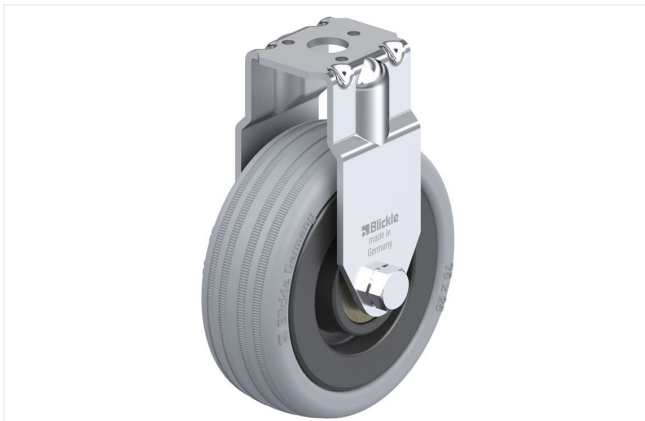
Roulette fixe correspondante BRA-VPA 75K