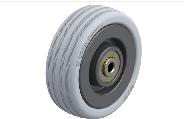
Roue utilisée VPA 75/6K