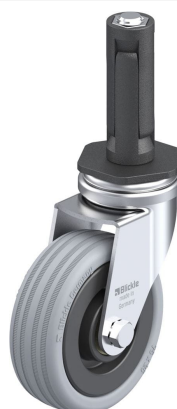
Roulette pivotante correspondante LRA-VPA 75K-ER02