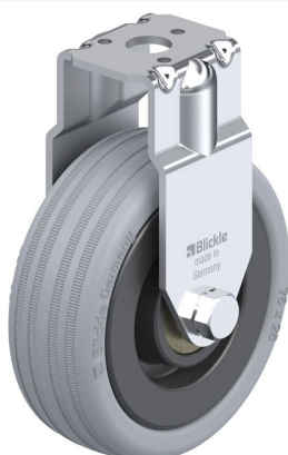
Roulette fixe correspondante BRA-VPA 75K