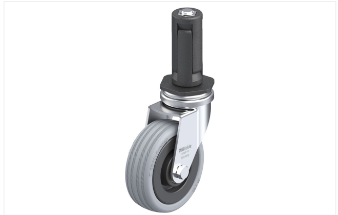
Roulette pivotante correspondante LRA-VPA 75K-ER03