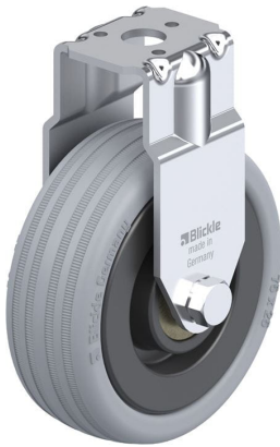
Roulette fixe correspondante BRA-VPA 75K