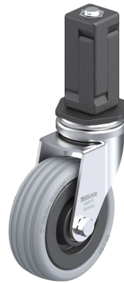
Roulette pivotante correspondante LRA-VPA 75K-EV04