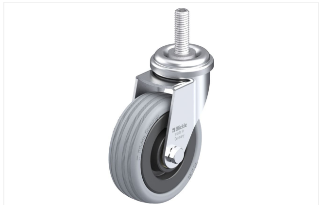
Roulette pivotante correspondante LRA-VPA 75K-GS10