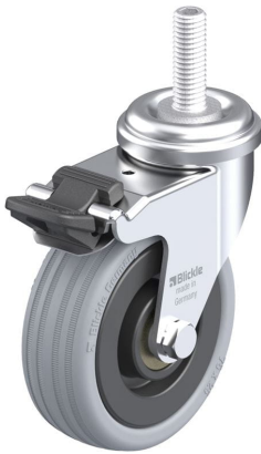
Blocage standard associé LRA-VPA 75K-FI-GS10