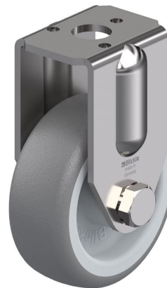
Roulette fixe correspondante BRXA-TPA 50G