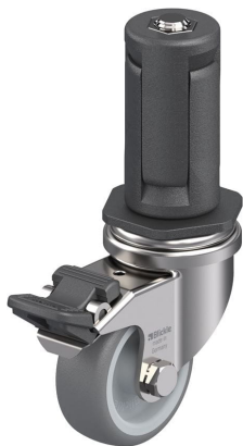
Blocage standard associé LRXA-TPA 50G-FI-EXR04