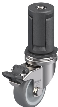
Blocage standard associé LRXA-TPA 50G-FI-EXR05