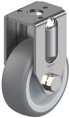
Roulette fixe correspondante BRXA-TPA 50G