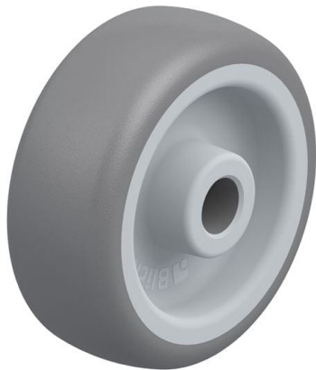
Roue utilisée TPA 50/8G