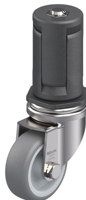
Roulette pivotante correspondante LRXA-TPA 50G-EXR05