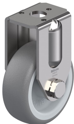
Roulette fixe correspondante BRXA-TPA 50G